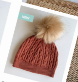
Gorro Pompón Venus 24.50€