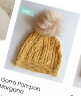
Gorro Pompón Morgana 24.50€